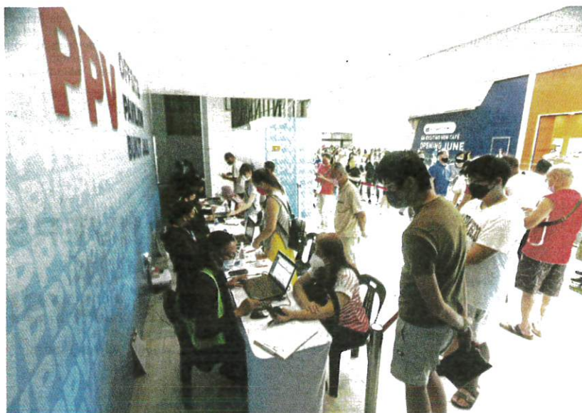
Orang ramai beratur bagi menerima suntikan dos penggalak kedua COVID-19 di Pavilion Bukit Jalil, Kuala Lumpur, semalam.

Lima kumpulan lain yang layak menerima dos penggalak kedua adalah individu berusia 60 tahun ke atas dengan atau tanpa komorbiditi berisiko tinggi serta mendapat saranan daripada pengamal perubatan.