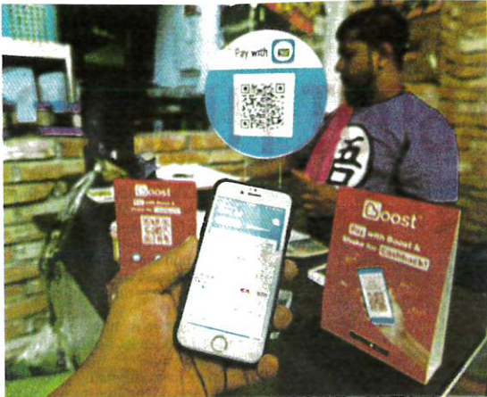
A customer using an e-wallet application to pay his bill at a Kuala Lumpur restaurant.