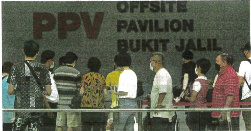
People queuing to enter the Pavilion Bukit Jalil mall in Kuala Lumpur to get their second booster dose of the Covid-19 vaccine yesterday.